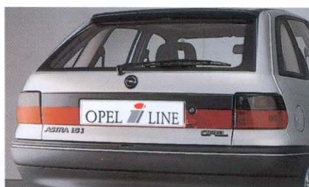
Achterplaten (tot 08/94) in rood/zwart i 18 17 004 of rood/geel i 18 17 005.

dakspoiler, met of zonder geïntegreerd derde remlicht, completeren het accessoire programma. Rookglas achterlichten en getinte achterplaten geven de sportieve Astra Hatchback de finishing touch.