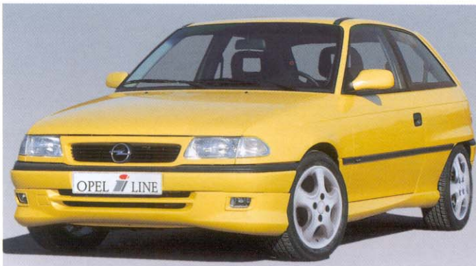
Voorspoiler i 18 01 049, Dorpellijsten i 18 01 349/399.