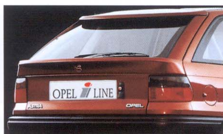
Achterspoiler i 18 01 446 en dakspoiler i 18 01 449 (tot 08/94) zijn een elegante verfraaiing van de Astra.

dakspoiler, met of zonder geïntegreerd derde remlicht, completeren het accessoire programma. Rookglas achterlichten en getinte achterplaten geven de sportieve Astra Hatchback de finishing touch.