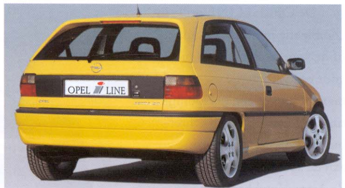
Dakspoiler met geïntegreerd 3e remlicht i 18 01 445.

Er zijn vele variaties mogelijk, waardoor de keuze moeilijk wordt. Wordt het een complete ombouw met voorbumper, achterbumper en dorpellijsten met deurplaten of wordt alleen een fraaie voorspoiler gemonteerd op de originele bumper? Voorspoiler en achterbumper zijn zo op elkaar afgestemd dat een perfecte