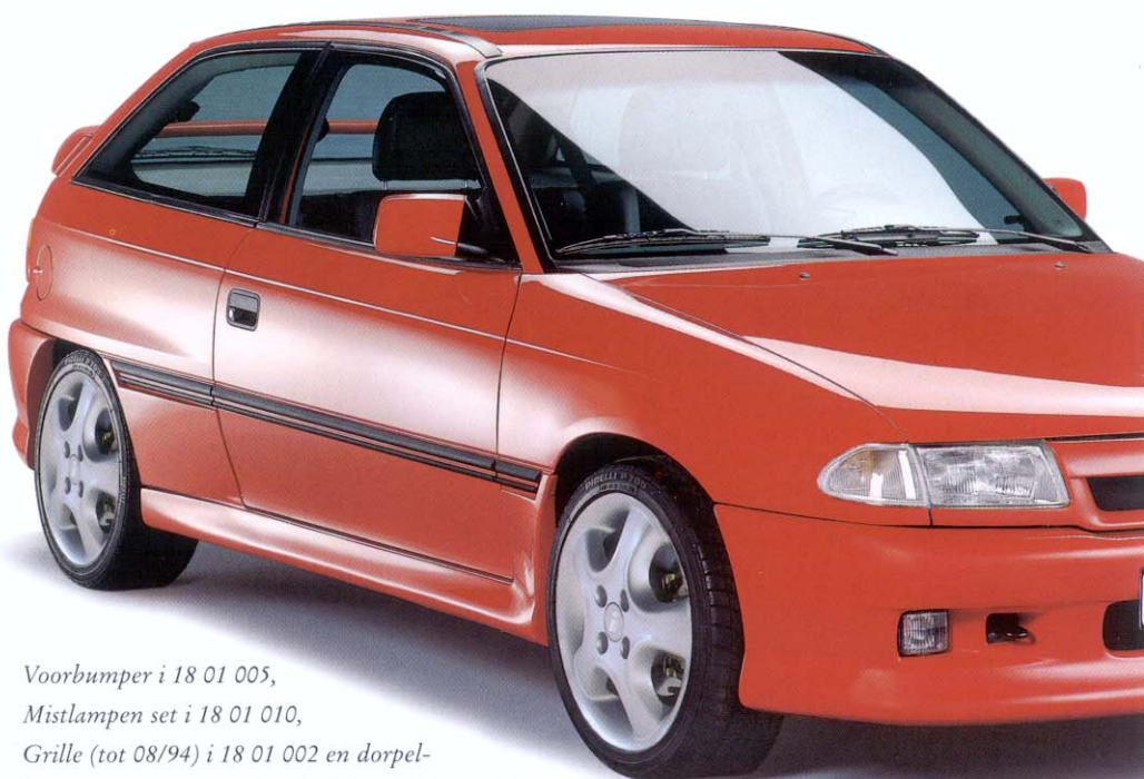
Voorbumper i 18 01 005, Mistlampen set i 18 01 010, Grille (tot 08/94) i 18 01 002 en dorpel- lijsten met deurplaten (tot 08/94) i 18 01 301/351.

velgen helpt mee het Astra uiterlijk te verfraaien, de luchtweerstand en de aandrijfkraften te verbeteren. Stuurwielen en interieursets in een klassiek wortelhouten-look of een sportieve Carbon-look geven het interieur een heel persoonlijk tintje. Door uitgebreide tests, voor elk Astra model apart, bereikt elke wegliggingssset een grotere zekerheid en een sportieve uitstraling.