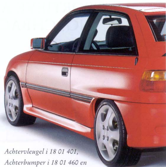
Achtervleugel i 18 01 401, Achterbumper i 18 01 460 en Uitlaat nademper i 18 08 040.

Het brede scala aan aërodynamische delen en lichtmetalen